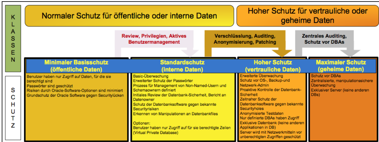
Abb. 2: Risikomatrix: Klassen und zu reduzierende Risiken

Im zweiten Schritt definiert man eine Risikomatrix: